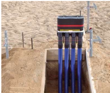
Hauseinführung für Gebäude ohne Keller

Weiterführende Informationen erhalten Sie auf der Internetseite des Fachverband Hauseinführungen für Rohre und Kabel e.V. www.fhrk.de